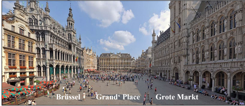
Brüssel Grand' Place Grote Markt

Wir sehen den Place Royale , den Justizpalast , das Regierungsviertel und die Kathedrale St. Michael . Die von Ringstraßen umgebene Altstadt gliedert sich in die tiefer gelegene, ältere flämische Unterstadt und die auf Hügeln gelegene wallonische Oberstadt . Mittelpunkt der Unterstadt , ist der Grand' Place (französisch) oder Grote Markt (niederländisch), der als