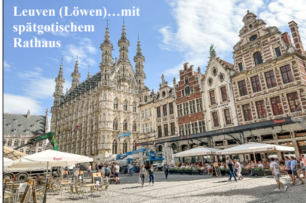
Leuven (Löwen)...mit spätgotischem Rathaus

des spätgotischen Stils, reicher in den Einzelheiten als die Rathäuser von Brügge, Brüssel und Gent. Die drei Fassaden sind mit zahlreichen Skulpturen geschmückt. In den Nischen sind bedeutende Persönlichkeiten aus der Geschichte der Stadt dargestellt. Direkt gegenüber des Rathauses steht schon die nächste Sehenswürdigkeit: die St. Peters Kirche . Die gotische Kirche ist mit ihrem romanischen Vorgängerbau aus dem 8. Jahrhundert die älteste Kirche Leuvens. Die Kirchtürme der St. Peterskirche sind nicht hoch, sie wurden aufgrund des sandigen und instabilen Bodens nie fertig errichtet. Leuven ist auch ein Paradies für Bierliebhaber , denn hier wurde Stella Artois , ein Pilsner Bier mit 4,8 bis 5,2 % Alkoholgehalt, in der Brouwerij Artois in Löwen, Belgien , seit 1926 hergestellt. Die Anfänge der Brauerei gehen bis 1366 zurück. 1537 ist die Brauerei das größte Unternehmen der Stadt Löwen. Sebastien Artois wird 1708 Braumeister bei Den Horen . 1717 übernimmt er die Brauerei und gibt ihr den Namen Brouwerij Artois . Das Weihnachtsbier Stella (Stern) wird 1926 auf den Markt gebracht. Die backsteinernen Anlagen mit Hafenanchluss in der Stadt Löwen wurden 1993 aufgegeben und durch eine neue Produktionsstätte am gleichen Ort ersetzt. Nach einer Reihe von Übernahmen gehört Stella Artois heute zum weltweit größten Braukonzern Anheuser-Busch . Der Nachmittag steht uns für eigene Erkundungen in Leuven , zur freien Verfügung.