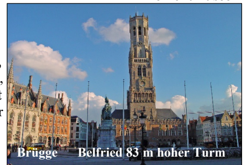
Brügge Belfried 83 m hoher Turm

4. Tag Freitag, 16. Mai 2025 9:00 Uhr Abfahrt Seebäder an der Nordseeküste