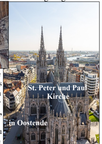
St. Peter und Paul Kirche