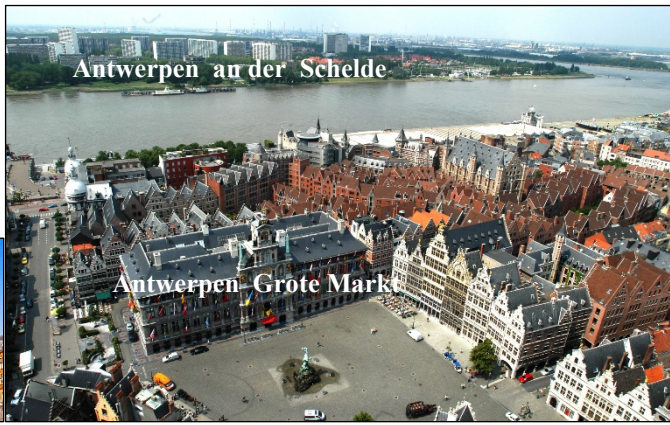
Antwerpen an der Schelde