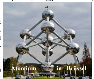
Atomium in Brüssel

①②③ Brüssel die Haupt- und Residenzstadt des Königreichs Belgien, liegt im Zentrum des Landes und zählt 1,21 Millionen Einwohner. Die Textilindustrie ( Brüsseler Spitzen ) genießt Weltruf. Erstmals im Jahre 966 als Bruocsella erwähnt, ist Brüssel seit dem 12. Jahrhundert Sitz der Herzöge von Brabant , die damals von der Tuchindustrie lebten. Unter den Habsburgern wurde Brüssel die Hauptstadt der Niederländer und ist seit 1830 Hauptstadt Belgiens . Heute ist Brüssel offiziell zweisprachig , auch wenn das Französische dominiert. Stadtteile, Straßennamen und Bahnhöfe sind seitdem zweisprachig beschildert. 1958 wurde Brüssel zum Sitz der Europäischen Wirtschaftsgemeinschaft (EWG). Im selben Jahr fand die 2. Brüsseler Weltausstellung Expo 1958 statt, die eines ihrer berühmtesten Bauten, das 102 Meter hohe Atomium , hinterließ. Wir machen einen Fotostop , um das beeindruckende Bauwerk aus der Nähe zu betrachten. Anschließend erwartet uns eine Stadtrundfahrt .